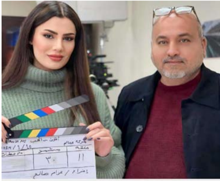
العودة إلى مجال الإخراج بعد غياب دام عقدا كاملا

عملية الخطف واسلوب تحرير الخطف كانت افتعالية وضعيفة وسط حوارات ركيكة ابدأ لا تشبه اعمال صباح عطوان ولم يستطع المخرج انقاذ مثل هكذا النص ان لم يزد من فشله . وهو المخرج الذي قدم لنا اعمالاً افضل واغنى من هذا المسلسل مثل (باص في عصر العولة، الهروب المستحيل . امطار النار. سيدة الرجال. سواد الليل.