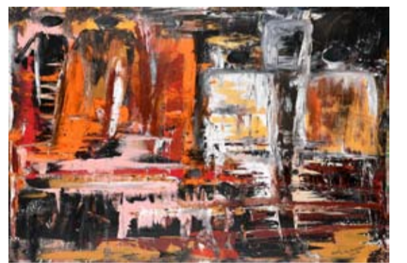
الفنانة / نواف ابراهيم العبدالله