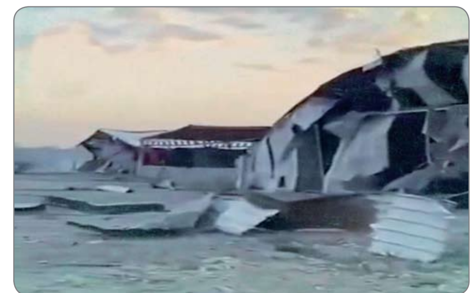
انفجار قاعدة (كالسو) يحتاج الى اجابات كي لا يبقى مبهما !!

أعلنت خلية الإعلام الأمني. امس السبت. المعطيات الأولية لحادثة انفجار معسكر كالسو في بابل. مشيرة الى انه لم يكن هناك أي نشاط جوي في عموم المحافظة قبل وثناء الانفجار. وقالت الخلية في بيان انه «في الساعة (١٠:٠٠) الواحدة بعد منتصف ليلة أمس الاول. حدث انفجار وحريق داخل (معسكر كالسو) شمالي محافظة بابل على الخط الدولي. الذي يضم مقرات لقطعات الجيش والشرطة وهيئة الحشد الشعبي. ما أدى الى استشهاد احد منتسبي هيئة الحشد الشعبي وإصابة (٨) آخرين بينهم منتسب