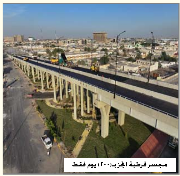
مجسر قرطبة الجز بـ(٢٠٠) يوم فقط