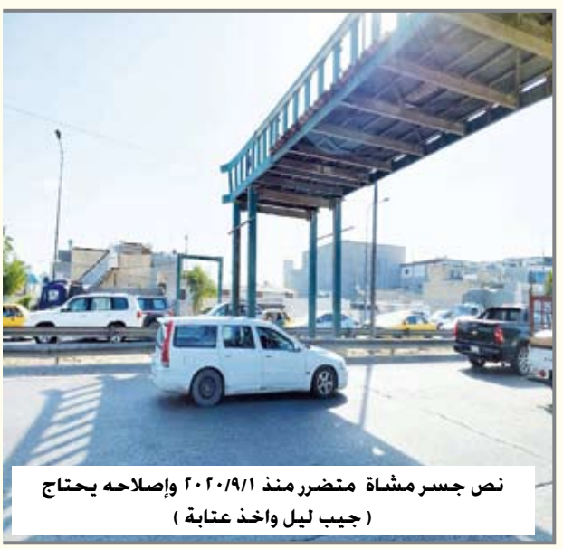
نص جسر مشاة متضرر منذ ٢٠٢٠/٩/١ وإصلاحه يحتاج (جيب ليل واخذ عتابة)

(نص ردن) كناية أو تهكماً بمن لا يجيدون عملهم أو مهنتهم بشكل سليم فنقول: هذا الشخص (مو أسطه مضبوط) بل (نص ردن).. وشاعت مفردة (نص ردن) حتى صارت تُستخدم للإشارة الى بعض الساسة فنقول: هذا سياسي (نص ردن).. ولكن دعونا من هذا كله.. هل سمعتم أعزائي القراء بـ (نص جسر مشاة) في إشارة الى أحد الجسور المخصصة لعبور المشاة وتحديداً قبالة محكمة إستئناف بغداد/ الرصافة وإذا كانت الإجابة بالنفي فسأروي لكم حكايته من الألف الى الياء كوني متابعاً له منذ اليوم الأول الذي حصل فيه حادث إرتطام شاحنة كبيرة لم يراع سائقها تعليمات السلامة ما أدى الى إتهيار أجزاء منه وتحديداً في (٢٠٢٠/٩/١).. وقد قامت أمانة بغداد يومها برفع الجزء المتضرر وبقي (نص جسر) وهو على هذا الحال منذ أكثر من ثلاث سنوات.. ويتاح لمن يسلك الطريق السريع من ملعب الشعب الدولي باتجاه