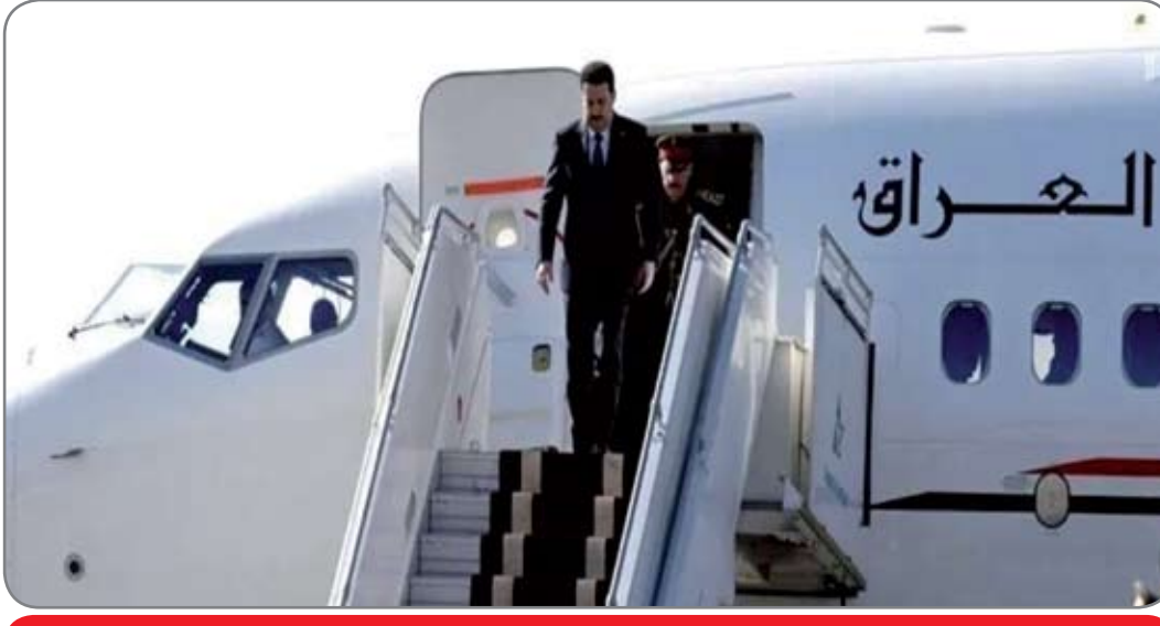
السوداني يعود الى بغداد بعد اختتام زيارته الرسمية لواشنطن

عاد الى بغداد. امس السبت السيد رئيس الوزراء "محمد شياع السوداني" بعد زيارة الى الولايات المتحدة الأمريكية استمرت عدة ايام وتشير كل المخرجات والمعطيات بان الزيارة كانت ناجحة بامتياز وان ثمارها اليانعة سيقطفها شعبنا العراقي خلال قايبلات الايام .. لقد امتازت الزيارة بنشاط استثنائي للسيد السوداني حيث تضمنت اجراء سلسلة متواصلة من اللقاءات والمباحثات والندوات والجلسات الحوارية والفعاليات الاخرى التي اعد لها بعناية فائقة لتأتي بما تشتهي سفن العراق من نتائج تصب في خدمة المصلحة العامة ابتداءً ببقاء الرئيس