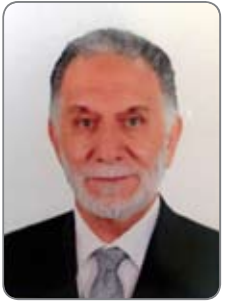
علاء كرم الله

تعليم يقينا بأن الله عز وعلاه هو الغفور لعباده والرحيم الخلقه وهذا ما جاء بالقرآن الكريم وبكل الكتب السماوية . وكذلك نعرف بأن حلم الله بالثف عام ، وغيرها الكثير ما يتصل برحمة الله وغفرانه وقبوله بتوبة خلقه من الخطيئة على أن تكون توبة نصححة صادقة . بالمقابل سمعنا ما نقله لنا موروثنا الشعبي من أمثال عامية مثل (أن الظالم سالم) و(عنة الكافر من ذهب)! . ومن المؤكد أن ما نقله