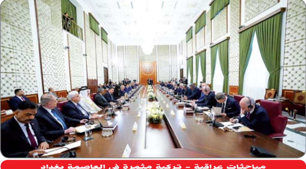
مباحثات عراقية - تركية مثمرة في العاصمة بغداد