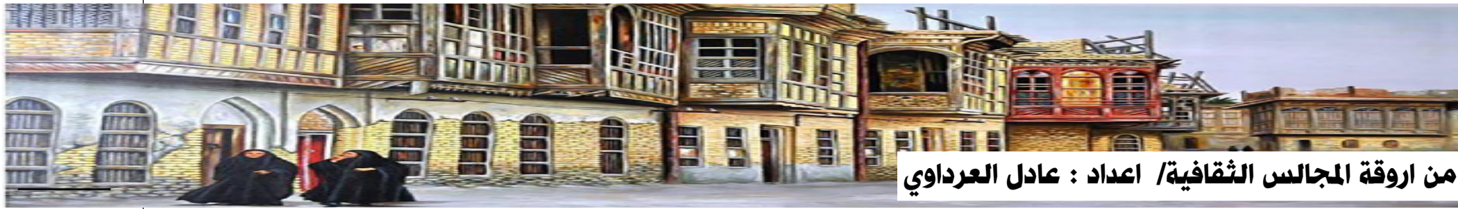
من أروقة المجالس الثقافية/ اعداد : عادل العرداوي