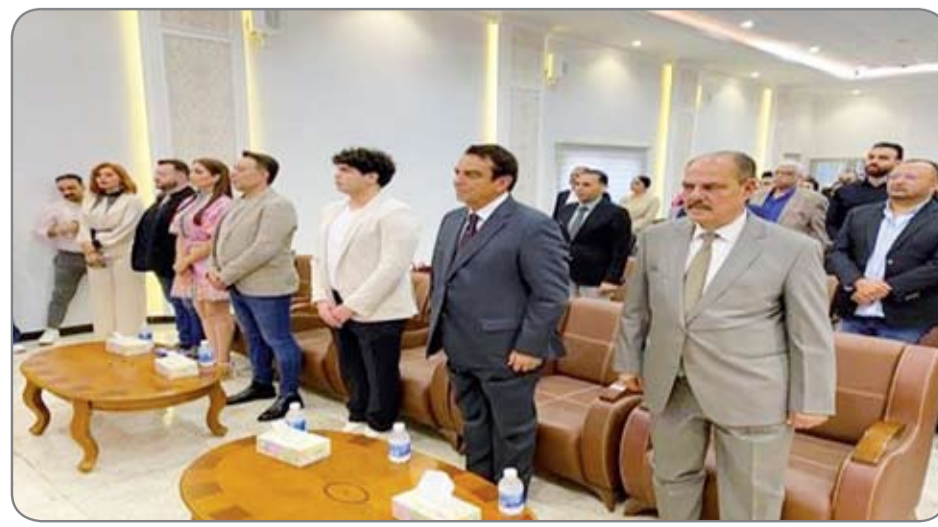
نقابة الصحفيين العراقيين اقامت امس ملتقى الاعلام العراقي العربي عن «تحديات الاعلام العربي في ظل التحول الرقمي»

بالاساليب والاجراءات المعتمدة في مجال فرض الغرامات المرورية التي صارت شبحاً يطارد سائقي المركبات ولا سيما المتضررين .. فهل ستتحرك المرور العامة لمعالجة الأمر قبل أن يقع الفأس بالرأس ؟. على صعيد آخر أكد رئيس تيار الحكمة الوطني عمار الحكيم ورئيس الجمهورية السابق برهم صالح، على اعتماد الدستور سبيلا لحل الإشكالات العالقة، مشيداً في الوقت نفسه بالتفاهات التي أسهمت في إقرار جداول الموازنة وحل أزمة رواتب موظفي الإقليم، وأكد الحكيم أيضا على إدامة الانفتاح العراقي على المحيط العربي والإقليمي والدولي، مبينا أن التجربة أثبتت حاجة المنطقة لاستقرار العراق كقمة مستقرة، داعياً إلى إدامة الحوار وتعشيق المصالح وتمكين شعوب