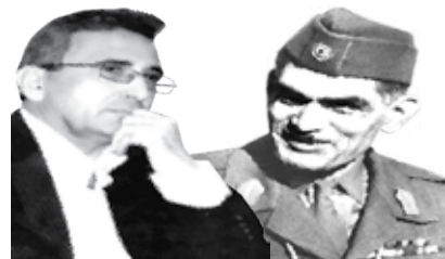
أسسها الراحل سيدنا الجاني

جريدة يومية سياسية عامة لا ترتبط بحزب أو حركة أو أية جهة دينية أو سياسية