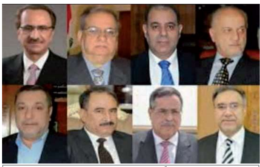
وزراء الكهرباء السابقون (يسلمون عليكم من أوروبا ويكلوكم خو مو حارة يممكم)

ونحن إذ نكتب في أجواء حارة لا نملك إلا أن نرفع الأكتف متضرعين الى الله تعالى داعين بأن ينتقم من كل وزير تسلم مسؤولية الكهرباء ولم يقم بأداء واجبه بما يرضي الله تعالى وشعبه وضميره .. والمضحك المبكي إن من تسببوا بتردي واقع الكهرباء يعيشون الآن في دول أوربية حياة مخرمة ومرفهة ويتمتعون برواتب تقاعدية وامتيازات ضخمة بحدود (٤٠) مليون دينار وينطبق عليهم المثل الشعبي (نايم المدلول حلوة نومته) بينما المواطن العراقي الفقير يعيش على سطح صفيح ساخن.. ولكن تذكروا إن (حويبة) العراقيين ستطارد كل من قصر بحقهم الى يوم الدين.