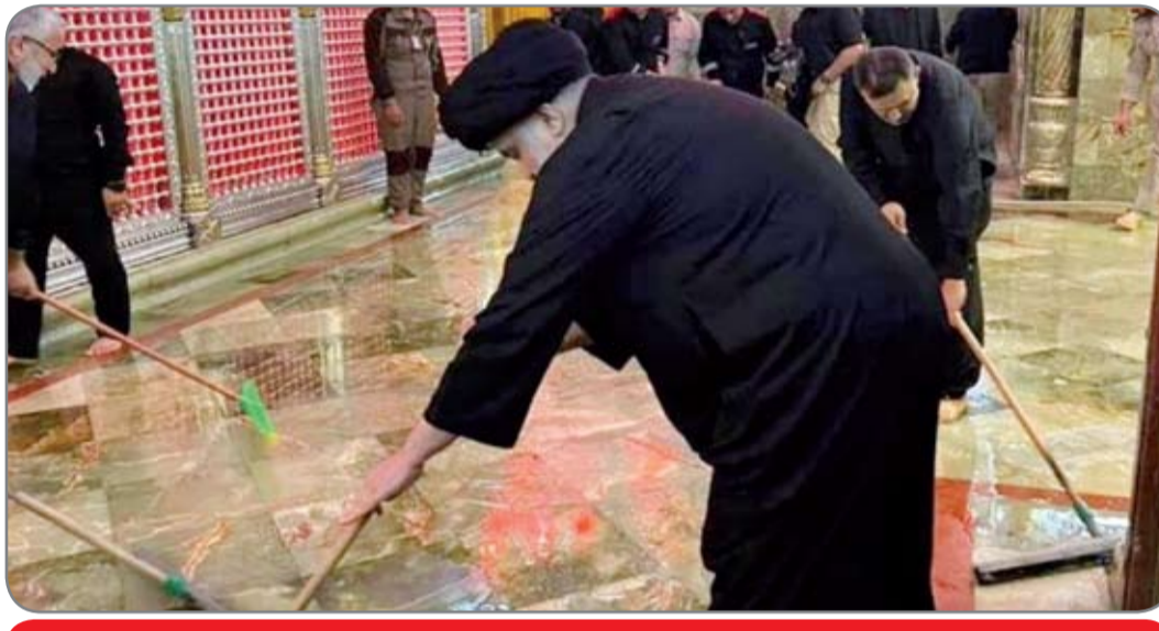
السيد مقتدى الصدر يشارك في غسل العتبة العلوية المطهرة

فاز والنقطة الأهم هو الشروع بإجراءات عديدة وخطط مدروسة لمطارة تجار المخدرات والشبغ بالشبغ يذكر فقد استطاع العراق أن يطيح برؤوس كبيرة من المتورطين بهذه التجارة القذرة كما نجح العراق في إبرام مذكرات تفاهم مع دول عديدة في هذا المجال ويكفي للدلالة على جهودنا الأمنية ان الأشهر الستة الماضية ضبط مواد مخدرة بكمية إجمالية بلغت طناً و(٨٢٢) كيلو غراماً من مختلف أنواع المواد المخدرة كما انخفضت نسبة المخدرات بواقع (٤٪) مقارنة بالأشهر الستة الأولى من السنة الماضية.