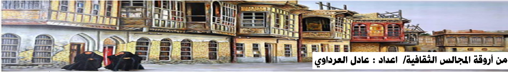
من أروقة المجالس الثقافية/ اعداد : عادل العرداوي