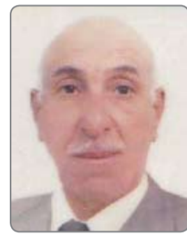
محمد عبدالرضا جمعة

وداغستان والشركس. هؤلاء الناس يتمتعون بجمال لا مثيل له. حيث الوجه المدور الابيض والعيون السود الكبيره. أخذ الامراء الاتراك يشترون هؤلاء الناس ليستخدمونهم كخدم في بيوتهم، وحتى بعض الاحيان كانوا يستخدمونهم لاغراض غير اخلاقيه. وعندما يكبرون يزوجهم بنات الامراء. وبعدها يصبحون امراء ويحكمون في بلاد الشام ومصر . حكموا العراق ٨٢ عاما ولي بغداد المملوكي داود باشا سرق من اهله من تفلين في جورجيا وكان عمره ١١ عاما وكان جميلا جدا وحيء به الى العراق واشتره أحد وجهاء بغداد مصطفى البرعي و باعه بعد اسبوع وكان يباع ويشترى وفي النهاية استقر عند والي بغداد سليمان الطويل وراه واعتنى به ودرس الفقه في مدرسة الشيخ عبد القادر. وتزوج احدي بنات سليمان ابنة سعيد واليا على العراق وتأمر عليه داود وقتل سعيد شر قتله عن طريق سيد عليوي مدير شرطة بغداد لاحقا (هم سيد الخائن)....وقطع راس